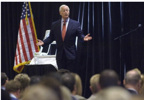
ไบรอัน เทรซี (Brian Tracy)

รายงานฉบับนี้จัดทำขึ้นโดยข้อมูลเท่าที่ปรากฏและเชื่อว่าเป็นที่น่าเชื่อถือได้แต่ไม่ถือเป็นการยืนยันความถูกต้องและความสมบูรณ์ของข้อมูลนี้ๆ โดยบริษัทหลักทรัพย์ ยูโอบี เคย์ ฮียน (ประเทศไทย) จำกัด (มหาชน) ผู้จัดทำขอสงวนสิทธิ์ในการเปลี่ยนแปลงความเห็นหรือประมาณการต่างๆที่ปรากฏในรายงานฉบับนี้ โดยไม่ต้องแจ้งล่วงหน้า รายงานฉบับนี้ไม่มีวัตถุประสงค์เพื่อใช้ประกอบการตัดสินใจของนักลงทุน โดยไม่ได้เป็นการชักชวนให้นักลงทุนทำการซื้อหรือขายหลักทรัพย์ หรือตราสารทางการเงินใดๆ ที่ปรากฏในรายงาน